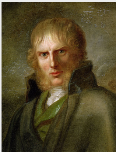
Ritratto di Caspar David Friedrich, Gerhard von Kügelgen, 1810-20 ca.