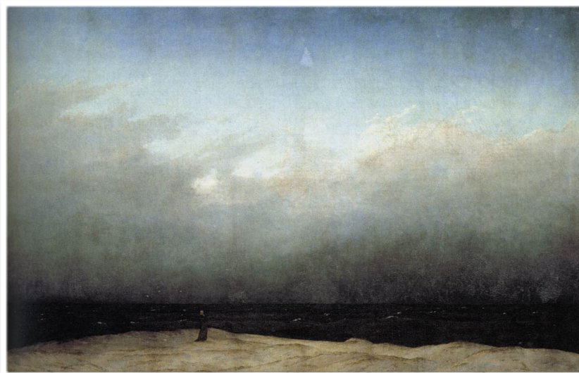
C.D. Friedrich - "Monaco sulla spiaggia" 1808-1810, olio su tela, 110 x 171, Alte Nationalgalerie, Berlino.