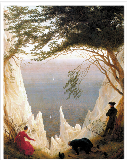
C.D. Friedrich - "Le bianche scogliere di Rügen", 1818, olio su tela, 90 x 70, Fondazione Reinhart, Winterthur.