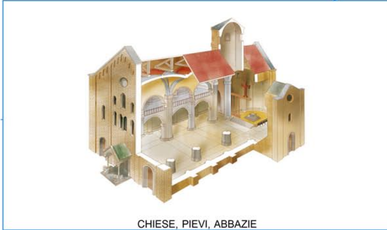
CHIESE, PIEVI, ABBAZIE